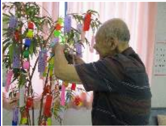
『飾り付けもご自身で』

向日葵が日に日に背を伸ばすこの頃、皆様におかれましてはいかがお過ごしでしょうか。デイケアでは今夏も恒例の『七夕レクリエーション』を実施致しました。まずはご利用者様お一人お一人、思い思いの願い事を短冊に書いて頂きました。願事は様々、『家族皆が健康でありますように！』『昆布の味噌漬けが食べたい！』『阪神タイガースが優勝しますように！』・・・。ついでにデイケア男性職員のかねてからの願望、