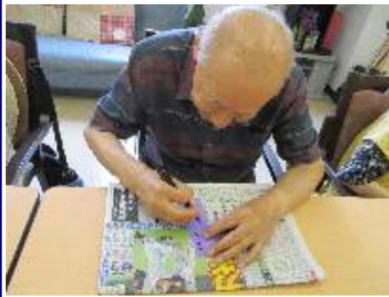
『短冊に願いを込めて』

向日葵が日に日に背を伸ばすこの頃、皆様におかれましてはいかがお過ごしでしょうか。デイケアでは今夏も恒例の『七夕レクリエーション』を実施致しました。まずはご利用者様お一人お一人、思い思いの願い事を短冊に書いて頂きました。願事は様々、『家族皆が健康でありますように！』『昆布の味噌漬けが食べたい！』『阪神タイガースが優勝しますように！』・・・。ついでにデイケア男性職員のかねてからの願望、