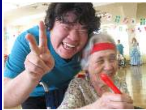
『笑顔で協カプレー』

去る六月十七日、暑い日でしたが、もう一つ熱いイベント長生苑運動会がありました！最初に現れたのは金髪美（？）女（？）のチアガール！どちらも個性的な方々でした。演目は玉入れ、大玉転がし、ピンポン玉リレーと玉、玉、玉と続いていきましたが、接戦に次ぐ接戦！そして、最後は綱引きです。まず女性職員の対戦。互いに『えー、無理やっつ〜』等と言いつつ合点ながら、いざ対戦！小柄な職員が勢いに負けて、