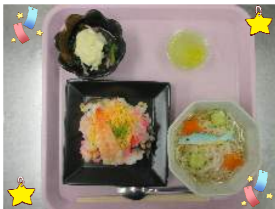
『色鮮やかなメニューでした』