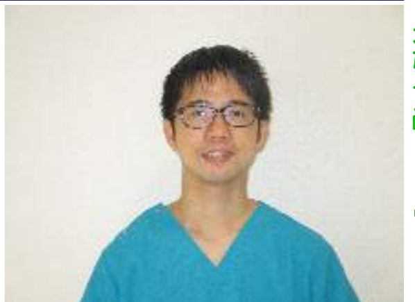
『どうぞよろしくお願いいたします』