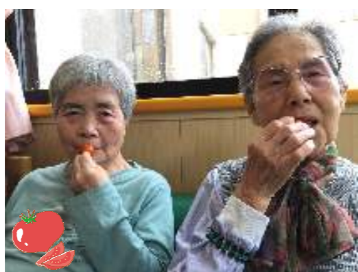
『ミニトマト頂きま〜す』