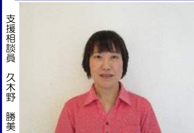
『明るく元気に接して参ります』

今年も新しい職員を迎えることができました。これからもより一層のサービスの質向上に努めます。皆様どうぞ宜しくお願い致します。