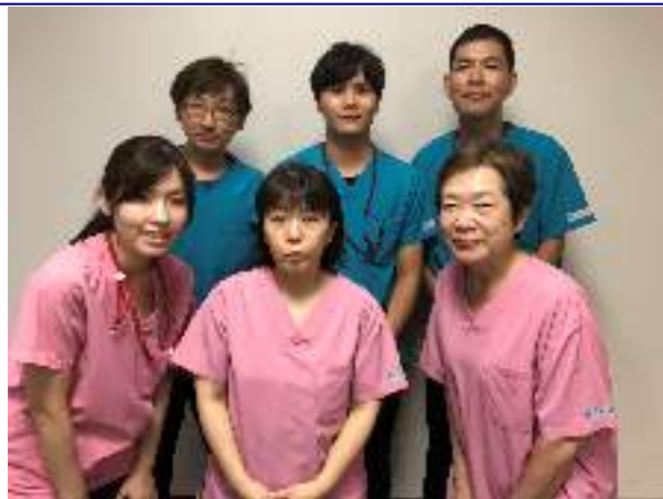
『笑顔でチームケア!』