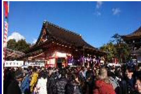
『八坂神社本殿と参拝風景』