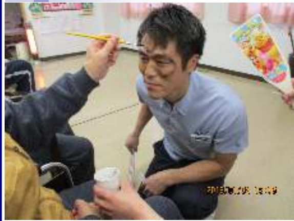
『職員の顔面で書初めです』

新年あけましておめでとうございます。皆様と共に新しい年を迎える事ができ嬉しく思います。さて今年には平成三十年になりました。デイケアの新年最初のレクリエーションは、正月ならではの『カルタ取り』と『羽根つき』です。昔懐かしのカルタをテーブルに広げると、皆さん札をじっと見て我先に取ろうと熱戦でした。ハイ！ご利用者様より声が上がります。お互いの手をたたかないようお