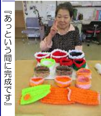
『あっという間に完成です』

願います。午後は職員同士で羽根つき対決。負けた職員の顔に利用者様が墨を塗り、更に盛り上がりました。またデイケアの利用者様は様々な手作業に取り組んでおられます。中には得意な手芸をされている方もおられ、他のご利用者様達も興味津々。完成した作品はビンゴ大会の景品にさせていただきます。今年もご利用者様の得意なことを伺いながら、色々なレクリエーションを考えていきたいと思えます。 デイケア 山崎 美和