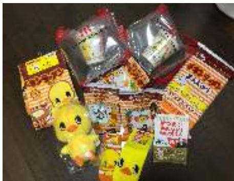
『可愛いグッズです』